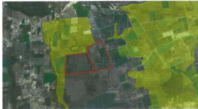
Imagen de referencia, Programa de Ordenamiento Ecológico Local