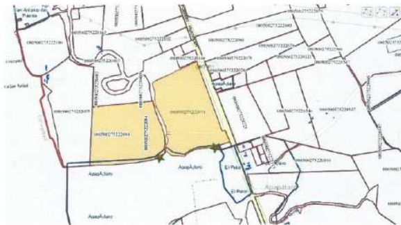
Imagen de referencia: Infraestructura de Datos Espaciales Catastro Querétaro

B) Que los predios en cuestión se encuentran dentro del límite normativo del Programa de Ordenamiento Ecológico Local de Huimilpan. Aprobado por el Ayuntamiento de Huimilpan en el Décimo Segundo Punto del Orden del día en el Acta no. 077, relativo a la Sesión ordinaria celebrada el 28 de marzo de 2018, publicado en el periódico oficial del Estado de Querétaro "La Sombra de Arteaga" no. 32 de fecha 20 de abril de 2018 e inscrito bajo el folio Plan de Desarrollo no. 00000048/0004 de fecha 5 de junio de 2018 en el Registro Público de la Propiedad y el Comercio, Subdirección Querétaro y bajo el folio Plan de Desarrollo no. 00000006/0002 de fecha 5 de junio de 2018, en el Registro Público de la Propiedad y el Comercio Subdirección Amealco. Mismo que establece lo siguiente para los predios en comento: